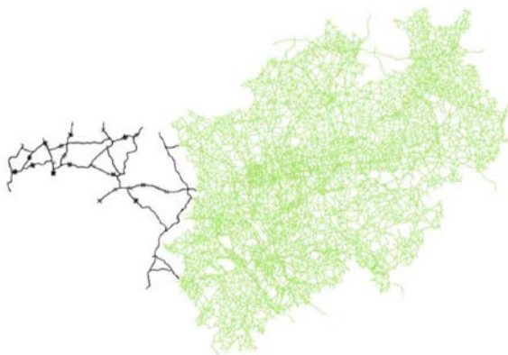
Bild 1: Grafische Übersicht eines gemeinsamen Datenraums aus Niederländischen (schwarz) und Deutschen (grün) Straßendaten aus verschiedenen Quellen in verschiedenen Datenformaten

Für eine Untersuchung der möglichen Nutzung der Modelle in jeweils anderen Kontexten wurden die im AP 5 beschriebenen inhaltlichen Betrachtungen von Mappings anhand mehrerer von der BAST und RWS zur Verfügung gestellter Datensätze für ausgewählte Szenarien untersucht. Dabei handelt es sich jeweils um ein Netzwerkmodell der Bundesfern- und Landesstraßen in Nordrhein-Westfalen sowie um das Autobahnnetz der Provinz Limburg, die an verschiedenen Stellen ineinander übergehen (Bild 1).