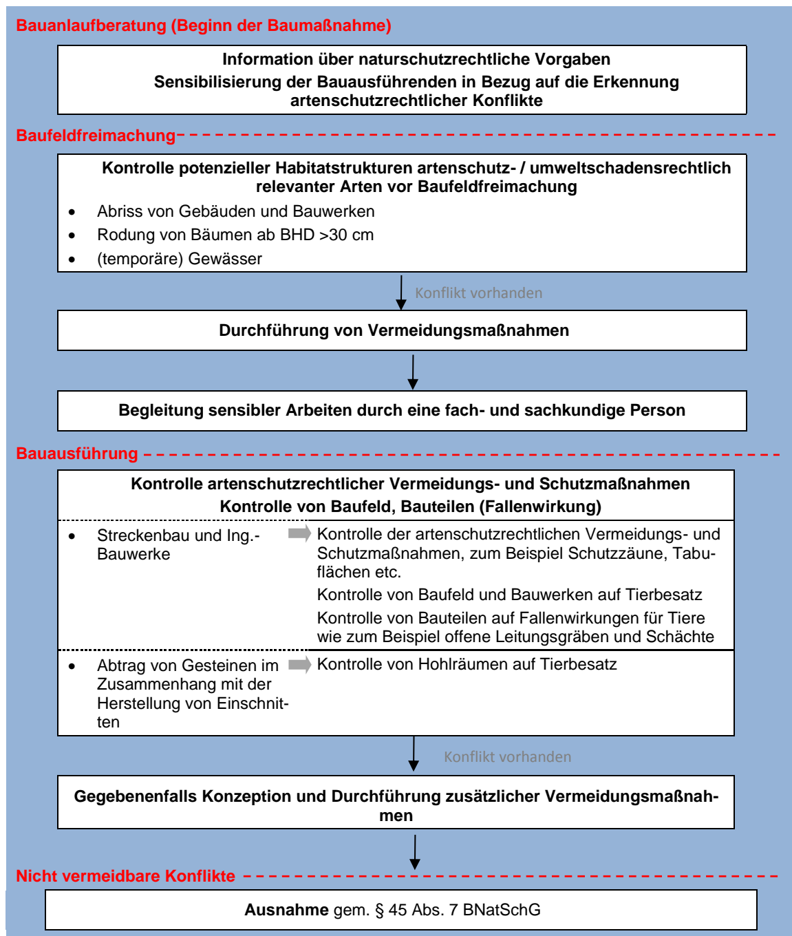
Bild 2: Schema Vorgehensweise Konfliktmanagement während der Bauphase

schutzrechtlichen Konfliktmanagement ableiten, sind im Forschungsvorhaben beschrieben.