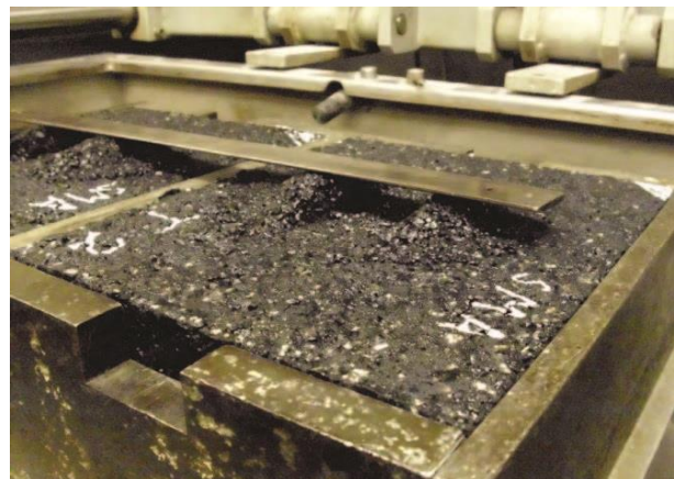
Bild 1: Mit Sanierungsmaterial verfüllter Prüfkörper im Spurbildungsversuch

Da es sich bei diesen Laborversuchen um Versuche für heiß zu verarbeitende Walzasphalte handelt, bedurfte es vor der Anwendung der Versuchsverfahren einiger Voruntersuchungen und teilweisen Modifikationen, um die Anwendbarkeit auf die zu untersuchenden Sanierungsmaterialien (Kalt-, Guss- und Sonderasphalte) zu gewährleisten. So erfolgte der Spurbildungsversuch an einer Asphaltprobekplatte, die mit einem zentrisch angeordneten und verfüllten Schlagloch (Durchmesser 10 cm, Tiefe 4 cm) versehen war (siehe Bild 1). Der Druckschwellversuch wurde in zwei Modifikationen angewendet, zum einen an Bohrkernen aus Schlaglochplatten und zum anderen an Marshall-Probekörpern. Beim erstgenannten konnte so eine seitliche Stützung durch Asphaltbeton realisiert werden, um möglichst realistische Beanspruchungszustände abzubilden. Beim letztgenannten erfolgte die seitliche Stützung mittels Stahling, sodass eine vollständige Behinderung der Seitendehnung vorlag.