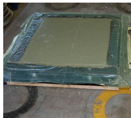
Bild 4: Wendeschalung nach der Probekörperherstellung und dem Wenden